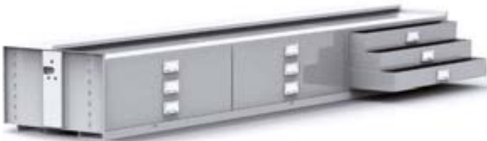
Monikäyttöhylly integroiduilla laatikoilla turvalliseen ja selkeään varastointiin