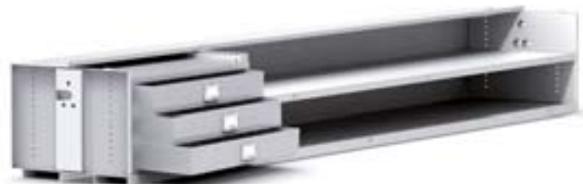
Hyllytaso vetolaatikoilla, väliseinällä ja välilyhyillä