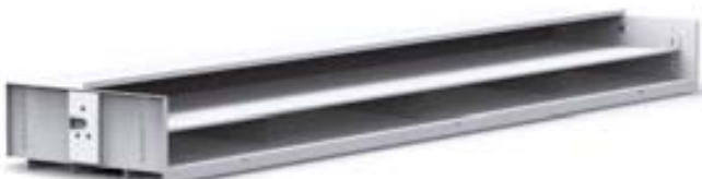
Monikäyttöhylly itsekantavalla välilyhyillä suurten ja litteiden tuotteiden varastointiin